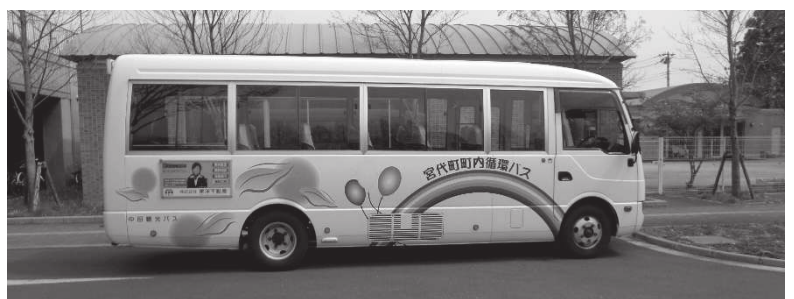
町内循環バス運行ルートの見直しを