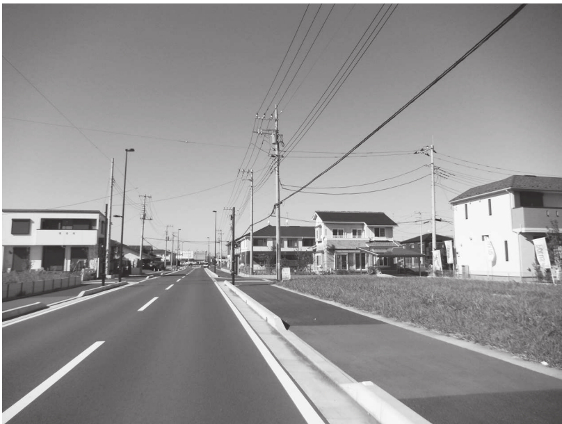
定住人口増に向けて建築が進む道仏地区土地区画整理地内