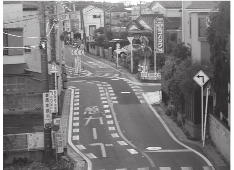
危険な五差路に歩道の設置を