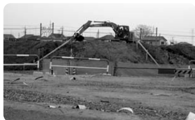
■着々と工事が進む道仏土地地区画整理地内