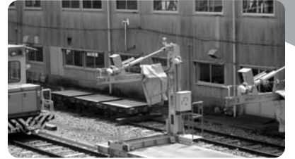
■開発が待たれる、東武動物講演駅西口 杉戸工場跡地