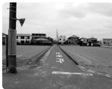
■拡幅整備工事が実施される中島地区町道第137号線